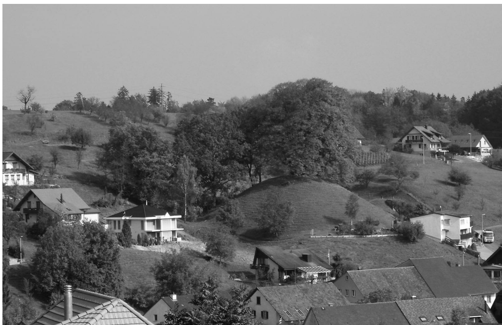
Abb. 1 Schupfart Herrain: Die Wehranlage von Südwesten.