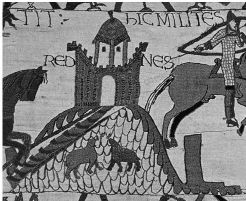
Abb. 4 Darstellung einer Motte auf dem Teppich von Bayeux (F) zwi- schen 1070 und 1082.

Wer die Wehranlage auf dem Herrain erbaute und wem sie als Wohnsitz diente, ist unsicher. Dass sie mit den Grafen von Homberg-Tierstein in Verbindung steht, ist hingegen wahrscheinlich. Seit dem 11. Jahrhundert besass die mächtige Hochadelsfamilie im damaligen Frickgau eine geschlossene Grundherrschaft. In Schupfart verfügte sie später über bedeutenden Besitz, darunter den Kirchenzehnten. 7 Eine Variante wäre daher, dass die Grafen die Wehranlage schon im 11. Jahrhundert erbauten und ihnen nebst den beiden Burgen Alt Homberg und Alt Tierstein als Wohnsitz diente. Eine andere Variante wäre, dass im Zeitraum des 10. bis 12. Jahrhundert ein aus der bäuerlichen Oberschicht aufgestiegener Grossgrundbesitzer aus Eigenantrieb die Befestigung errichtete – einerseits zur Abgrenzung seiner Stellung gegenüber der übrigen Dorfbevölkerung, andererseits zur Manifestierung seiner Besitzungen und Rechte. Dass es sich bei dieser Person um den legendären Hirminger gehandelt haben soll, der laut einer chronikalischen Überlieferung im Jahre 926 im Sisslerfeld die Ungaren überfallen und geschlagen hat, ist reine Spekulation. 8 Dieser Adelige, der dem Stand der so genannten