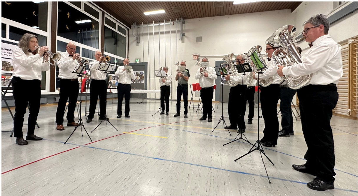
Musikgesellschaft Schupfart beim Ständchen zum Jubiläum

Jetzt neigte sich der Jubiläumsabend langsam, aber sicher dem Ende zu. Die Musikgesellschaft Schupfart spielte den anwesenden Gästen zum Jubiläum der Männerriege und zum Abschluss des Abends noch ein wunderbares Ständchen.